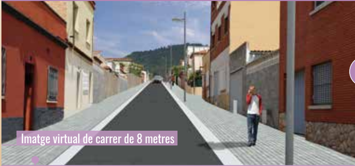
Imatge virtual de carrer de 8 metres

Tots junts decidim en què, on i com invertim els recursos per millorar la qualitat de vida del vostre barri