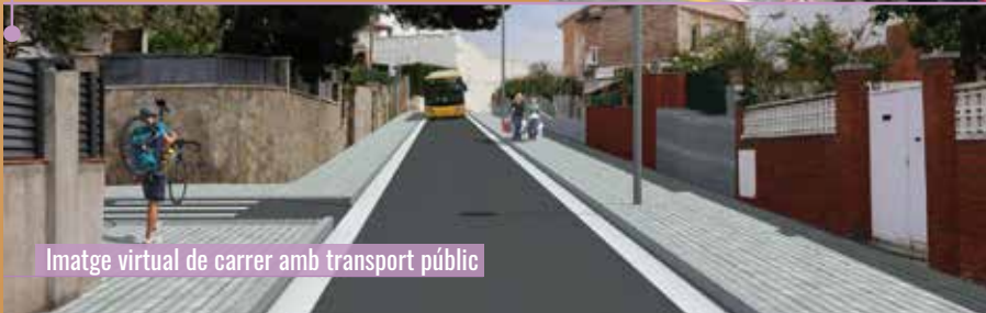
Imatge virtual de carrer amb transport públic