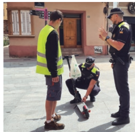
Control policial en la plaza de la Vila

En Viladecans hay una veintena de kilómetros de carriles bici en el núcleo urbano y otros 42 kilómetros de cicocalles, con velocidad limitada a 30 km/h para favorecer la convivencia de todos los vehículos por la calzada. ●