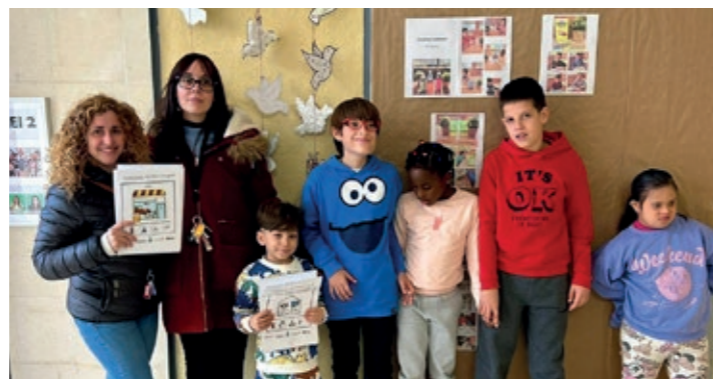
Infants participants, amb les educadores de carrer del barri

A l'escola s'han creat uns cartells amb pictogrames per facilitar als infants saber què és cada lloc i què s'espera que facin allà, i el servei municipal d'educadores de carrer ha fet la mediació amb una desena d'espais per instal·lar-los.