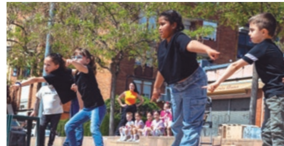
De dalt a baix, festes de barri de Can Guardiola, La Unió y Montserratina