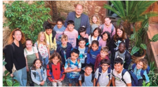
Escola Pau Casals