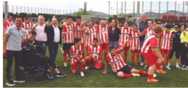
El equipo jugó en el estadio Johan Cruyff, en Sant Joan Despí