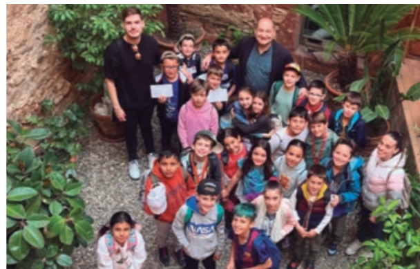
Escola Marta Mata