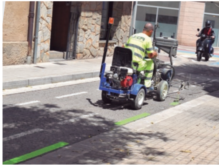
Tasques de senyalització de la nova zona verda al Barri de Sales

canvi, les verdes entraran en servei l'1 de setembre, quan també sigui vigent la nova Zona de Baixes Emissions, que restringirà la circulació dels vehicles més contaminants.