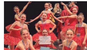
El conjunto de danza clásica

El Certamen Literario Constancio Zamora llega a su novena edición con la función de poner en valor las creaciones de poesía y relato corto. La Fundación Espejo ofrece un galardón de 300 euros a la mejor obra en cada categoría. Las propuestas pueden presentarse hasta el 22 de julio. Más información en info@fundacionespejo.com . ●