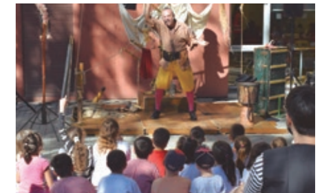
Charla y cuentacuentos por la diversidad