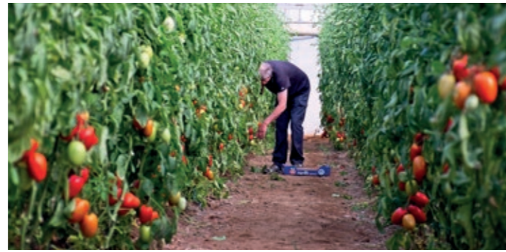
Hivernacle de tomàquets de l'empresa de Cal Xim Xim al Parc Agrari

també organitzarà dos tallers de cuina monogràfics sobre dos productes molt típics ara a l'horta local: el carbassó i el tomàquet.