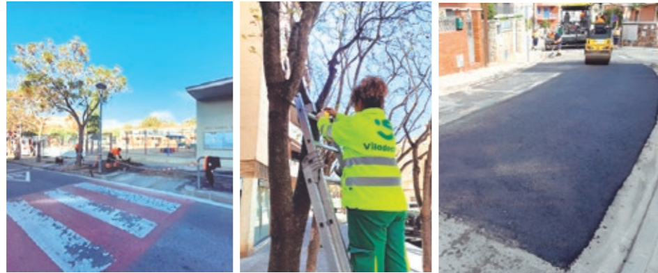
Reparación de acera, tratamiento fitosanitario en árboles y mejora del asfaltado en calzada