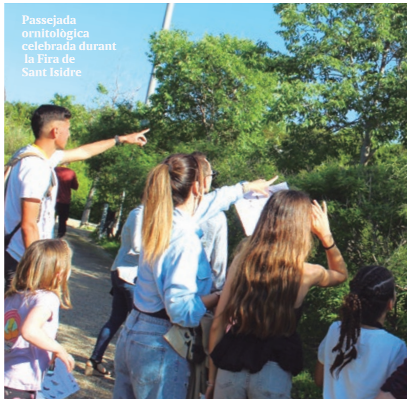
Passejada ornitològica celebrada durant la Fira de Sant Isidre

Així, Viu Verd aposta per accions que estenen la presència de vegetació i de biodiversitat al carrer i milloren la qualitat dels espais verds existents, des de la creació d'eixos verds a la potenciació d'hàbitats de fauna. Un dels reptes municipals