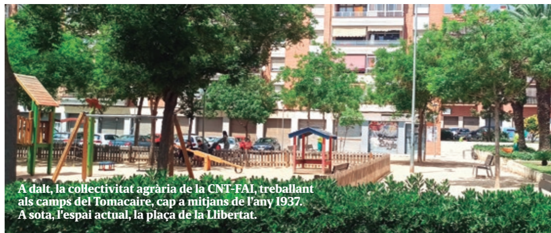
A dalt, la collectivitat agrària de la CNT-FAI, treballant als camps del Tomacaire, cap a mitjans de l'any 1937. A sota, l'espai actual, la plaça de la Llibertat.