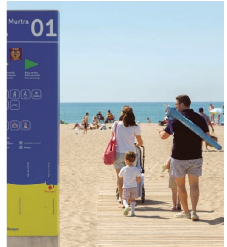
El Vilabús llega a la playa todos los días hasta el 1 de septiembre

El estacionamiento regulado, en marcha todos los días del 1 de junio al 22 de septiembre, empieza a desplegar este verano parquímetros para agilizar el acceso y el pago, aunque la implantación definitiva será en 2025 cuando llegue la fibra óptica hasta ese espacio.