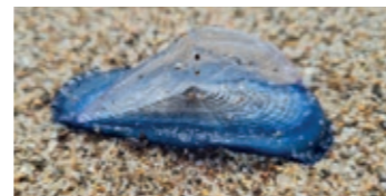
Barqueta de Sant Pere

biodiversitat al planeta. A la ciutat es van fotografiar 225 exemplars de 91 espècies diferents a través de la plataforma MINKA. A nivell mundial, el bioblitz va assolir en quatre dies un rècord de 2,5 milions d'observacions de 65.682 espècies en 51 països. ●