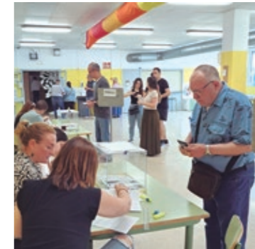
Votació el 12-M a l'Escola El Garrofer

La participació –en línia amb la mitjana catalana– va ser del 57,5%, vuit punts més que l'any 2021.