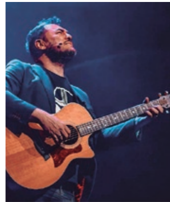
Ismael Serrano cerró la temporada

del parón a causa de la pandemia. La programación familiar ha sido una de las grandes protagonistas, con un 50 % más de espectadores (3.653 en total). El teatro cosechó catorce llenos, dos de ellos del grupo de teatro local Mossèn Cinto. Y es que la sala permite disfrutar de espectáculos de primer nivel y, a la vez, escaparate para la creación local. ●