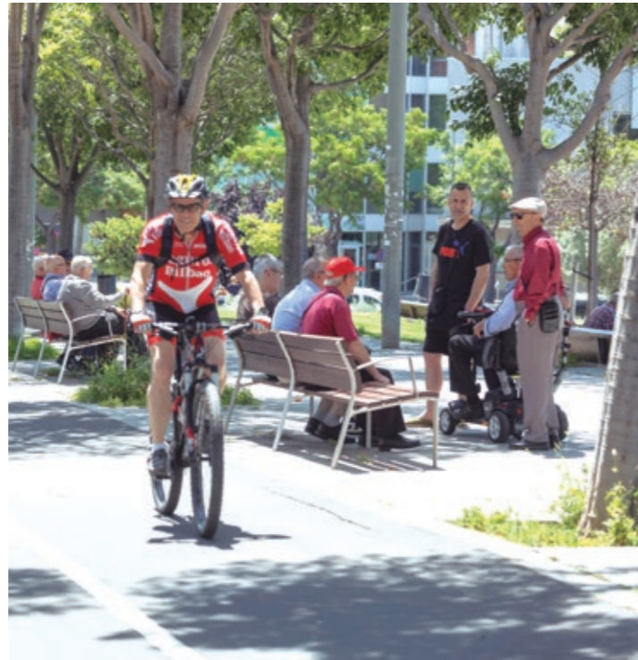
Un grupo de personas conversa en el parque del Torrent Ballester

El análisis también ofrece recomendaciones para potenciar las variables que pueden mejorar y para mantener unos altos estándares. Entre la veintena de propuestas de este año están, entre otras, mejorar la ordenanza de civismo, promover el servicio municipal de mediación en las comunidades vecinales, aumentar la oferta de vivienda social, promover el conocimiento de la ley de segunda oportunidad o incorporar medidas sociales alternativas a las sanciones. ●